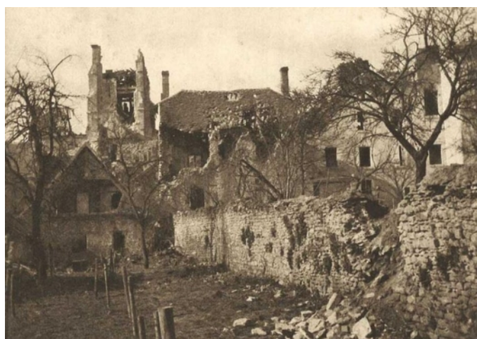
Craonne (Aisne), entièrement détruit, fut reconstruit quelques années plus tard.

Réformé temporairement pour "séquelle d'entoxication par gaz : emphysème pulmonaire et laryngite chronique" le 14 mai 1920, pension proposée de 25% qui après plusieurs examens de la Commission fut fixée à 50% en 1963 !!!